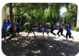
Peste 50 de evenimente dedicate