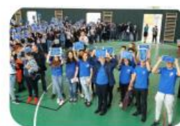
Dezbateri, întâlniri, concursuri