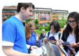
Împărțirea de materiale informative în comunitate