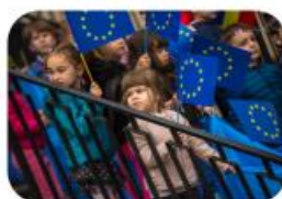
Festivaluri de dans, muzică și gastronomie

Activitățile de promovare au fost semnificative și în acest an, școlile folosind atât mijloace tradiționale (presă scrisă, TV, radio), cât și social media (paginile web ale școlilor, paginile de Facebook, Youtube). Majoritatea școlilor au diseminat activitățile și noua pagină de Facebook creată de Biroul de Legătura al Parlamentului European în România. Unele școli au publicat articole în revistele proprii, și au realizat materiale de promovare precum broșuri, postere, fluturași, iar altele au creat pagini web sau pagini de Facebook dedicate programului. În anul al treilea al programului, s-au înregistrat aproximativ 3 400 de articole / postări / reportaje la nivelul celor 75 de școli participante.